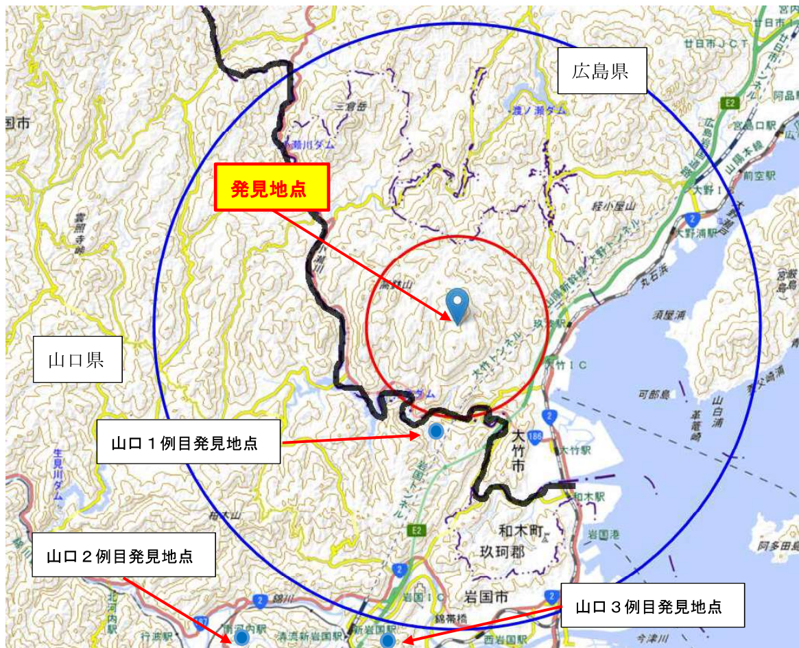
国土地理院の地理院地図をもとに広島県が作成

本情報については、無秩序な拡散防止のため複写・転写・他サイトへの掲載を禁じます。