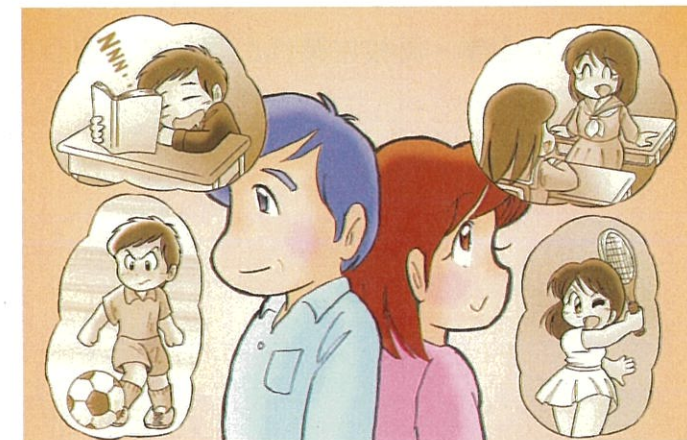
イラスト：うじな かずひこ

かわいいわが子も大きくなり、今では背丈も親を追い越しそう…体だけでなく、心の中も大きく変化しているようです。 やたら反抗的な態度かと思うと、急に甘えてきたりして…なんだかとても複雑な様子。親の方も、腹が立ったり、不安になったり、戸惑うこともしばしばです。でも…私もあの頃はそうだったかも。 「あの頃」を思い出しながら、思春期真っ只中の子供との関わり方を考えてみましょう。