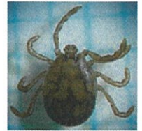
フタトゲチマダニ

気温の上昇とともにマダニの活動が活発になるため、この時期から、マダニが媒介する感染症への注意が必要です。昨年は、重症熱性血小板減少症候群（SFTS）により、県内で2名の方がお亡くなりになられています。畑仕事、草刈り、墓参りをされた方や60歳以上の方が多く感染しています。草むらや藪に入るときには、長袖、長ズボンの着用、忌避剤の使用等によりマダニに咬まれないよう注意しましょう。