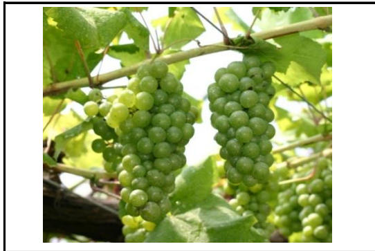
シャルドネ(ワイン原料ぶどう)