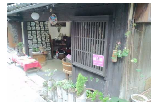
鞆町内商店の歓迎協力