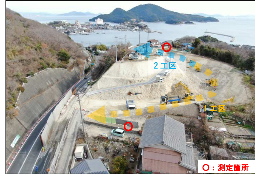
11月・12月の騒音・振動測定結果 (単位: dB)

引き続き、騒音・振動測定を継続するとともに、土埃対策としての路面への散水、ダンプトラックの安全運転の周知徹底等、周辺環境への配慮を行いながら、安全な工事に努めます。