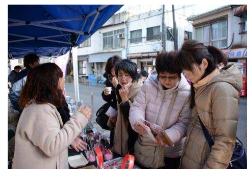
土産、物産テントの出店