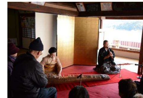
対潮楼での琴演奏