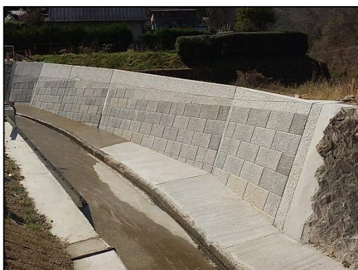
(二) 大元谷川（広島市安芸区）