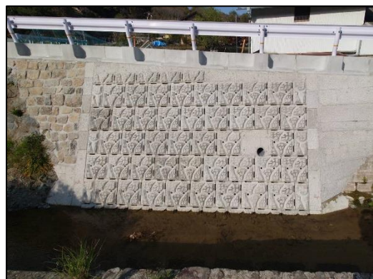
(二) 蛇道川（東広島市安芸津町）