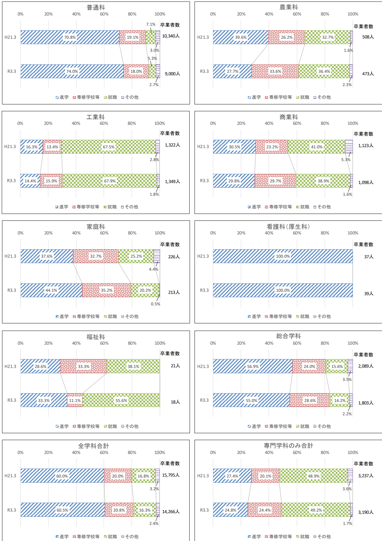
広島県の公立全日制高等学校の学科別進路状況（公立学校基本数による）