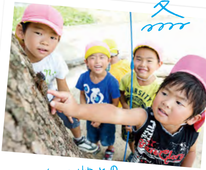
生き物とのふれあい