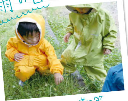
レインコートで散歩