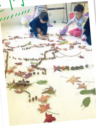
落ち葉もあつめて