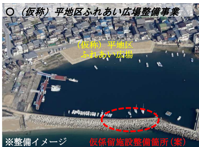
※整備イメージ 仮係留施設整備箇所(案)