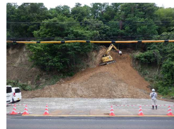
トンネルの東側出入口(坑口)の工事状況

当面は昼間(8:00～17:00頃)の施工となります。今後、トンネル内での作業に移行する際は、夜間の施工も実施しますので、時期が確定しましたら、この紙面でもお知らせします。