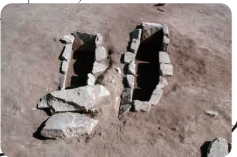
24 鞍ヶ谷北古墳群 (古墳時代) 並べて造られた石の棺