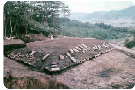
33 田尻山古墳群 (弥生時代) 四隅が飛び出した首長の墓