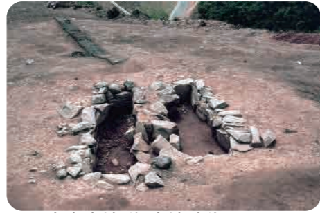
36 月貞寺古墳群 (古墳時代) 並べて造られた石の棺