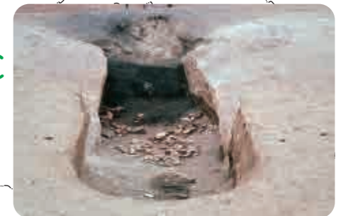
18 明連窯跡(飛鳥時代) 窯の床に残された土器