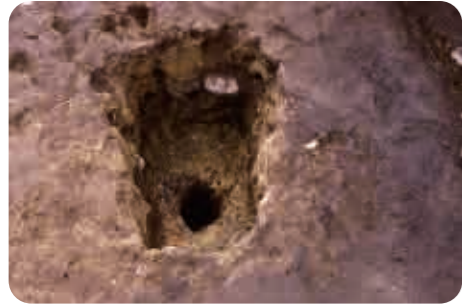
3 半坂遺跡(縄文時代) 動物をつかまえる落とし穴