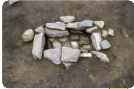
8 釜鋳谷遺跡(古墳時代) 子どもを葬った石の棺