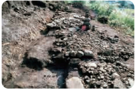
4 込山遺跡(室町時代) 石を敷いたお墓の基壇と石塔