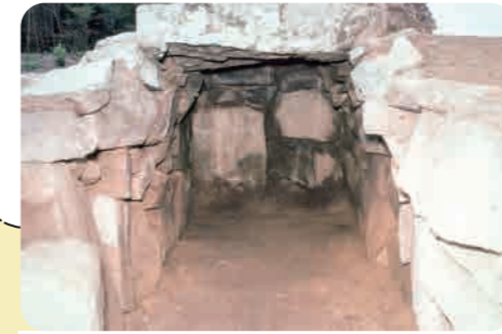
42 未渡大仙山第 5 号古墳 (古墳時代) 死者を埋葬する横穴式石室