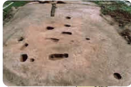
12 塚迫遺跡群(弥生時代) いくつも掘られた子どもを埋葬する穴