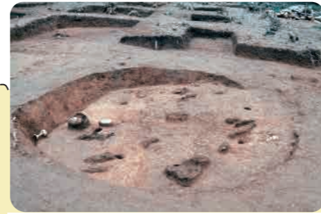
41 大原 1 号遺跡 (弥生時代) 竪穴住居の跡