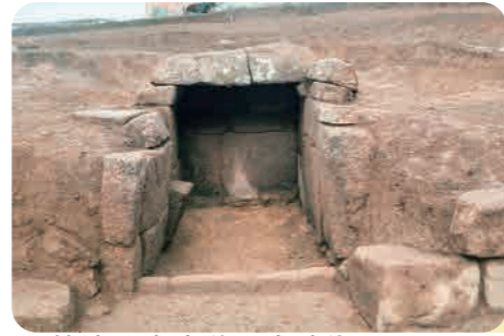
37 篠津原遺跡群 (飛鳥時代) 四角に加工した石を使った横穴式石室 この石室はみよし風土記の丘にあります