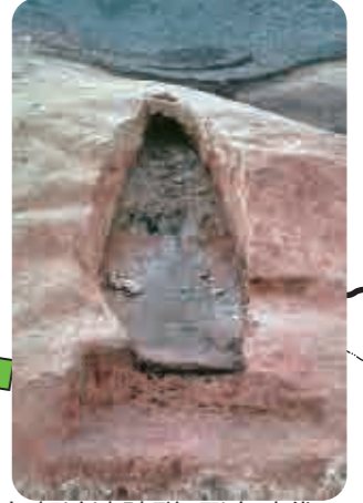
17 矢賀迫遺跡群(飛鳥時代) 斜面を掘り込んで造った土器を焼く窯