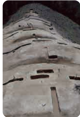
7 横路小谷古墳群 (古墳時代) 溝で区切って並ぶ古墳

中国自動車道のルートに多くの遺跡がありました！ 道路に表示されたKP（キロポスト）を頼りに、2万年の旅に出ませんか？