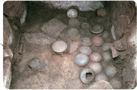
25 久々原第 10 号古墳 (古墳時代) 石室の床に敷き詰められた土器