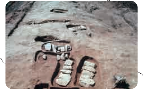
21 白鳥遺跡(古墳時代) 石で蓋をした墓穴

※KP(キロポスト): 中国自動車道の起点(大阪府吹田)からの距離。中央分離帯などに100mごとに表示されています。