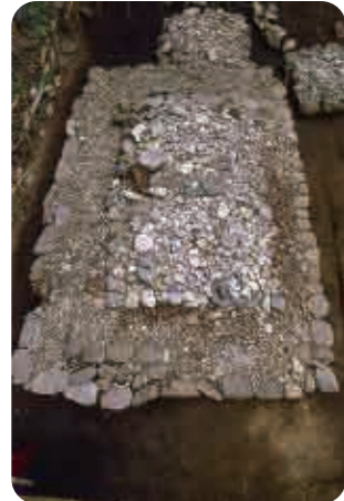
5 妙音寺原遺跡(室町時代) 石を四角く積んだお墓の基壇