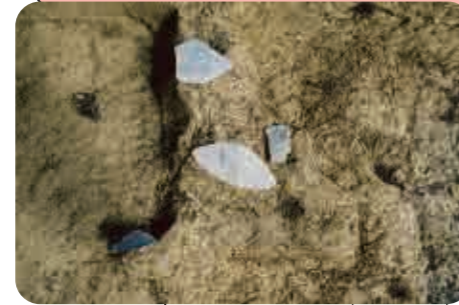
1 冠遺跡(旧石器時代) 見つかった石のヤリ先