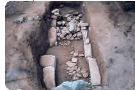
14 塩瀬神社裏古墳 (古墳時代) 横穴式石室の下半部