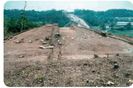
28 上四拾貫古墳群 (古墳時代) 石を巡らせた円形の古墳