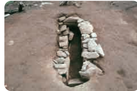
13 金子古墳群 (古墳時代) 死者を葬る石の棺