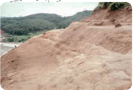
23 加井妻城跡 (室町時代) 急斜面につくられた段 (郭)