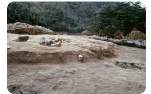
43 戸宇大仙山遺跡群 (古墳時代) 円形の古墳