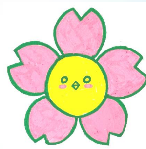
八千代小学校イメージキャラクター 「やちよう」