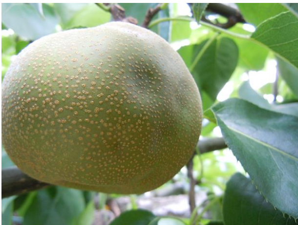
図3 果樹カメムシ類による被害果 (なし)