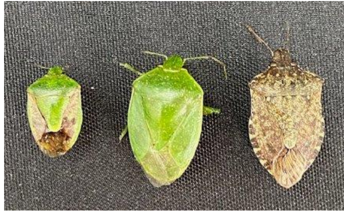
図2 果樹カメムシ類 (左からチャバネアオカメムシ, ツヤアオカメムシ, クサギカメムシ)