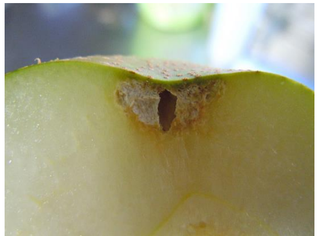
図4 果樹カメムシ類による被害果断面 (なし)