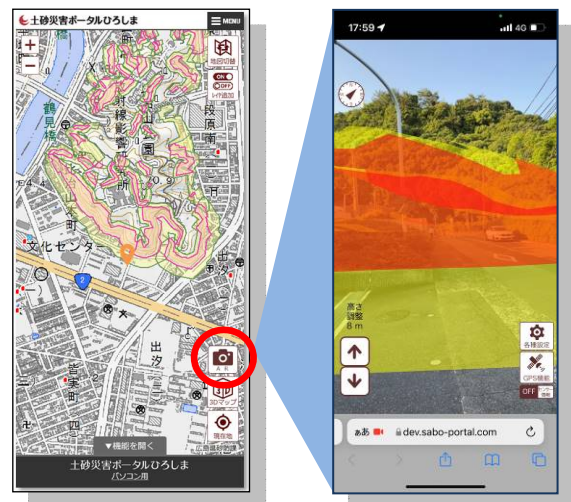
土砂災害警戒区域等のAR表示（イメージ）