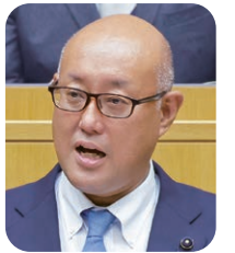
民主県政会 稲葉 潔 議員 (福山市)