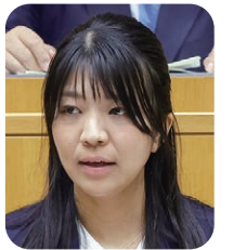
自民議連 灰岡香奈 議員 (広島市安佐南区)