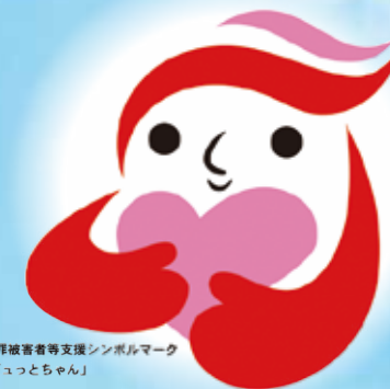
犯罪被害者等支援シンボルマーク 「キュっとちゃん」