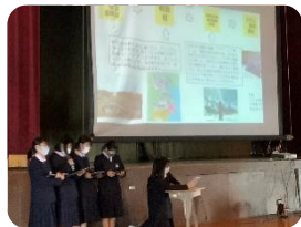
〈企画案のプレゼン〉

企画案を旅行会社に提案した。専門家としての助言を受けることで、新たな課題や更に深めることが生まれ、探究を継続して、細部