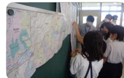
〈調べたことを地図上で共有〉

引野小、長浜小の学習は、相互評価や経験したことを生かすことで、「自分事」として課題を捉え、探究活動に繋げることができた。「自分事」は「学習がおもしろい」に繋がることが再認識できた。