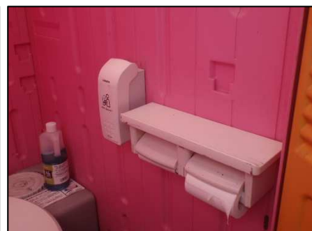
写真 便座除菌クリーナー