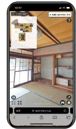
スマホでも自由な視点で確認が可能