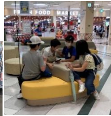
グループで過ごす