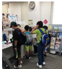
安全報告 公衆電話で 電話をかける (50円) (12時~13時の間)