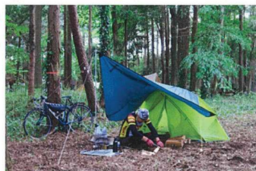
ソロ・デュオサイトの設置