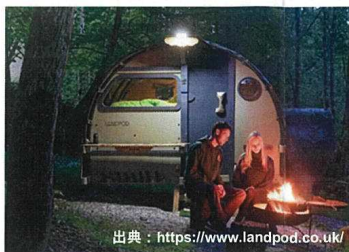
BBQ広場の雰囲気を活かし、新たなアウトドア体験を提供するLANDPODの設置