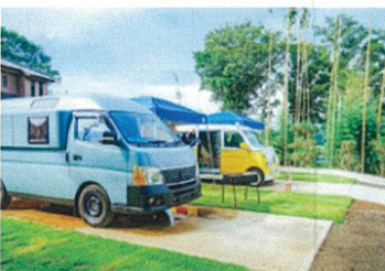
未活用駐車場を利用したRVサイトの設置