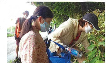
環境意識を高める プロギングと合わせたプラン提供