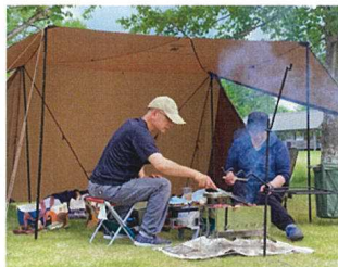
デイキャンプ場を利用者のニーズに合わせて使いやすく整備