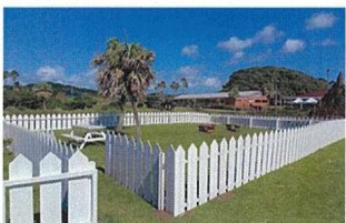
ペットと一緒に楽しめるドッグラン付きキャンプサイトの設置