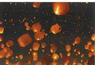
スカイランタンなど日常ではできないイベントの提供