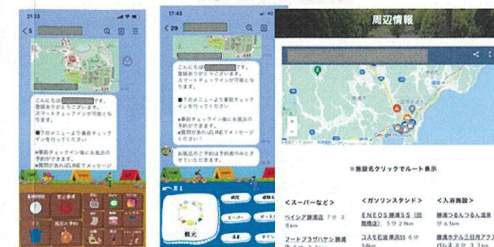
利用者の声をもとにしたサービス設計と利用促進 スマートフォンやパソコンでチェックインが完結する スマートチェックインの導入など