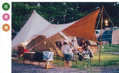
キャンパーニーズを捉える多様なキャンプサイトの設置と改修