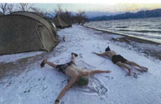
冬のテントサウナイベントの開催など冬の魅力に触れる機会の提供