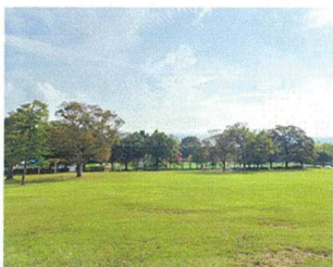
稼働が低い駐車場を芝生広場へフレキシブルに活用し賑わいをつくる