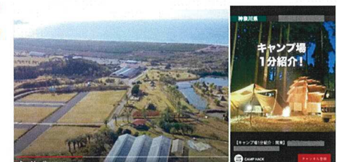
キャンプ場運営会社の親会社が運営する キャンプ場予約サイトや、関連会社が運営する日本最大級の アウトドアメディアを活用したエリア全体の広報活動の実施