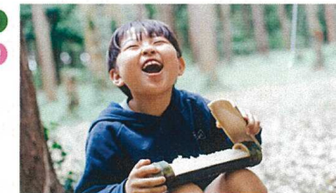
地域と連携した農業体験等と合わせたプランの提供