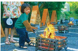
利用者ニーズを捉え、もみのき荘にアウトドア体験を+したサービス