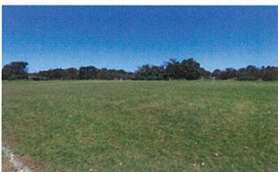
多目的グラウンドの芝生化によるサッカーの利用者の集客を強化