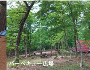
バーベキュー広場