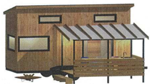
オールシーズンアウトドア体験が楽しめるタイニーハウスの設置