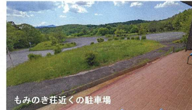
もみのき荘近くの駐車場