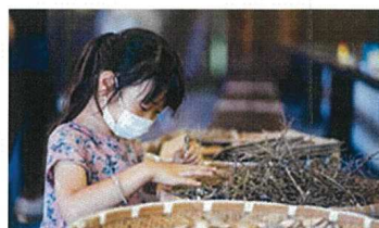
もみの木を使ったワークショップなど公園にあるものを活用した体験