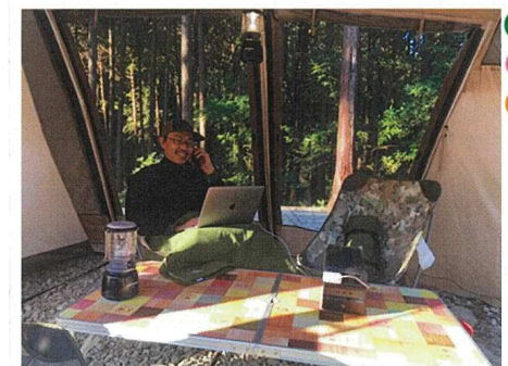
ニューノーマルなライフスタイルに対応した ワークショッププランや冬季の利用に適した レンタル品の提供