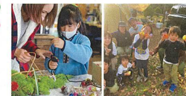
季節に応じたレポートを促進するミニイベントの開催