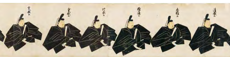
豪信《天子摂関御影(大臣巻)》(部分) 鎌倉～南北朝時代(14世紀) 【後期】