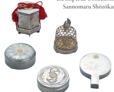
《ボンボニエール》各種 昭和期 【通期展示】

The Beauty of the Imperial Household in Connection with Hiroshima The Masterpieces of the Museum of the Imperial Collections, Sannomaru Shōzōkan