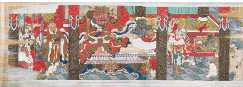
岩佐又兵衛《をくり(小栗判官絵巻)》巻十(部分) 江戸時代(17世紀) 【後期】