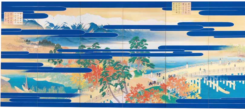
川合玉堂《昭和度 悠紀地方風俗歌屏風》(左隻) 昭和3年(1928) 【前期】