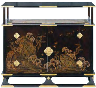
六角紫水ほか《蓬萊雲鶴時絵書棚》 大正6年(1917)

みどころ5 広島県出身の紫水らによって、 大正の立太子礼の記念として 製作された調度【後期に展示】