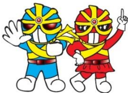
反射材活用促進キャラクター キラリ☆マンとキラリ☆ウーマン

この運動の実施結果を、 令和4年10月19日（水） までに広島県交通対策協議会交通安全対策部会事務局（交通安全対策室）へ提出すること。（報告様式等については、別途送付する。）