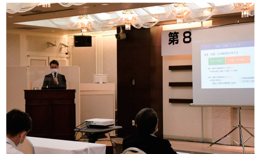
壇上は、医療労務管理アドバイザー