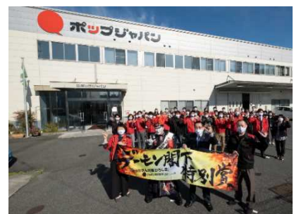
〈自社リスキリングプログラムの構築〉