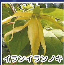
イランイランノキ