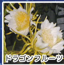
ドラゴンフルーツ