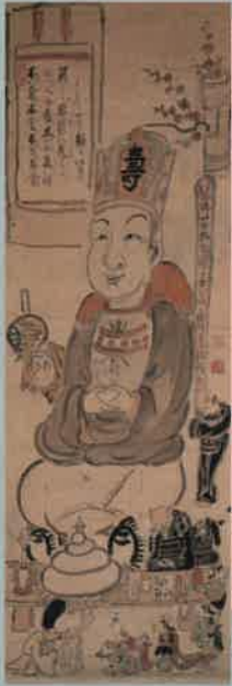
白隠慧鶴「大徳天圖」