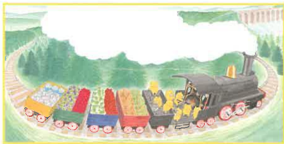
『ノラネコぐんだん きしゃぼっぼ』より