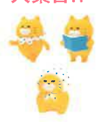
カプセルトイ 全12種+シークレット 緑賞会限定カラー「水色」 税込各400円