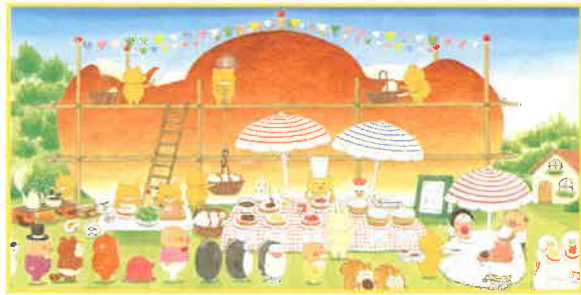
『ノラネコぐんだん パンこうじょう』より