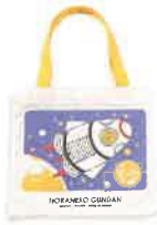
絵本トートバッグ (宇宙船) 税込1,980円