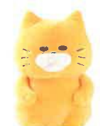
ぬいぐるみ はんせい (S) 税込2,640円 (M) 税込3,520円