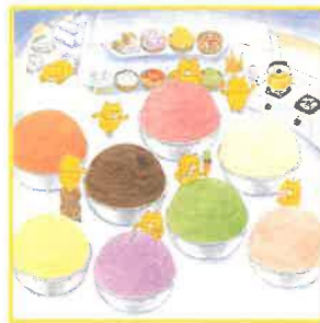
『ノラネコぐんだん アイスのくに』より