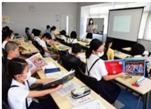
【三原市「子ども司書」の活動】

また、小学校、中学校、高等学校、特別支援学校の新学習指導要領において、学校図書館に関する役割が明記されている。総則では、「学校図書館を計画的に利用しその機能の活用を図り、児童（生徒）の主体的・対話的で深い学びの実現に向けた授業改善に生かす」とされている。