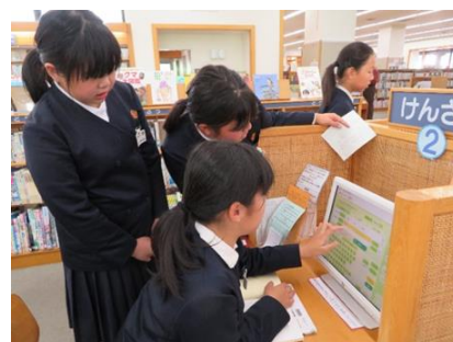
「図書館を活用した調べる学習」 府中市立栗生小学校

各学校では、公立図書館と連携し、各学校の読書活動年間指導計画等に基づき、読書活動の推進及び各教科等の授業での効果的な図書の利用の取組を進めている。