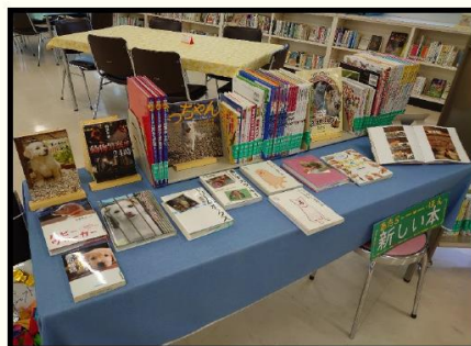
R3.図書館だよりおすすめ:動物の命(主に犬)