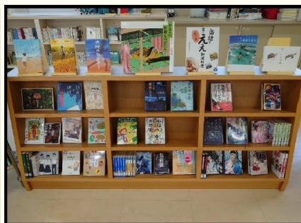
高校生向けセットと所蔵本(主に新しく入荷した本)

成果として、環境整備を行ったことで、児童生徒が学校図書館へ積極的に足を運ぶようになり、来館者数や貸出冊数が増加していることが挙げられる。モデル校の取組や実践事例については、県教育委員会が作成した「学校図書館リニューアルの手引」に掲載している。