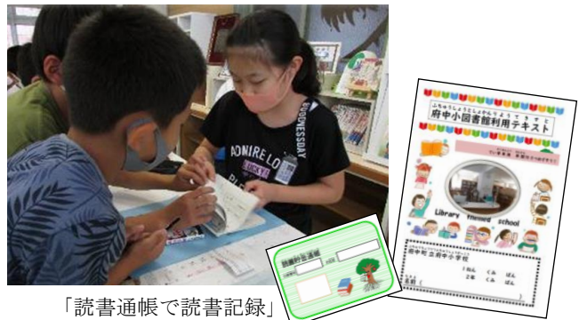
「読書通帳で読書記録」 府中町立府中小学校

各学校では、児童生徒の発達段階や実態に応じ、様々な本に触れる機会の確保や読書への関心を高める取組など、本に親しませる様々な取組が行われている。