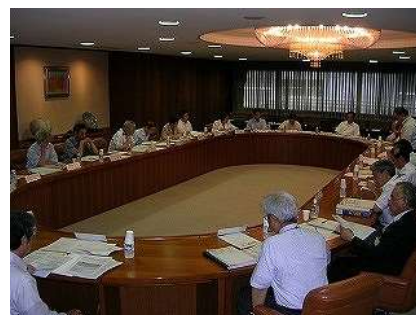
広島県食品安全推進協議会

消費者，生産者，事業者，市町の代表及び学識経験者並びに行政関係者による食品の安全対策に関する意見交換や次年度の食品衛生監視指導計画等について検討しました。