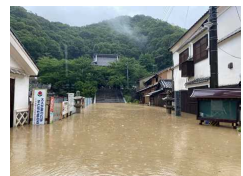
(令和3年7月 竹原市本川排水区)