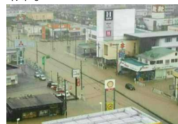
(平成30年7月 福山市蔵王排水区)