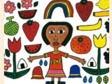
廣田 明日香 「フルーツバスケット」