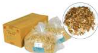
↑専用材料：NAF-6（アラミド繊維）