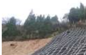
↑全景写真（施工完了）