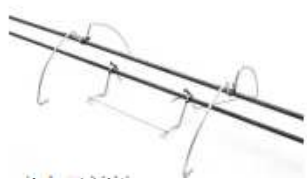
↑専用材料： 組立枠（ガッテnder-M型）