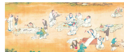
谷文晁画「対嶽楼宴集当日真景図」(部分、重要文化財菅茶山関係資料、広島県立歴史博物館蔵)

福山城築城400年記念事業 第19回全国藩校サミット福山大会関連事業 近世文化展示室「菅茶山と交流した藩儒たち」