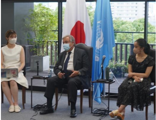
対話イベントの様子

おりづるタワー（広島市中区大手町1丁目2-1） ※オンライン配信の併用（日英同時通訳）