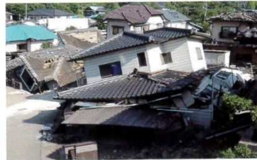
地震による被害例（熊本地震）

建築基準法は、国民の生命、健康、財産を守るため、建築物に求められる性能などのうち、建築物やそれによって構成される市街地の安全、衛生等を確保するために必要な基準が定められています。