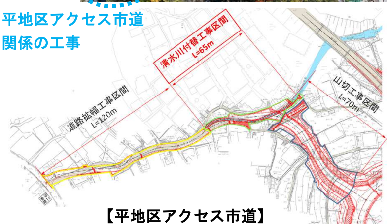
【平地区アクセス市道】