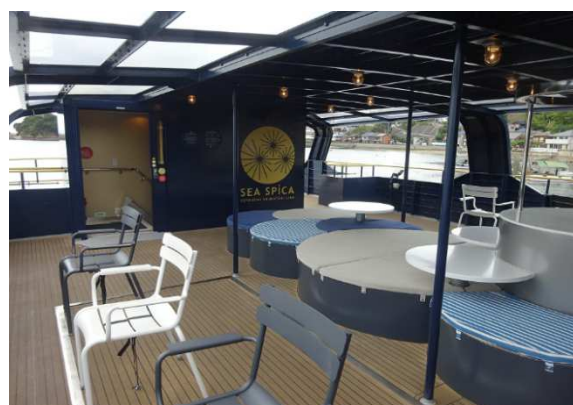
旅客船「シースピカ」