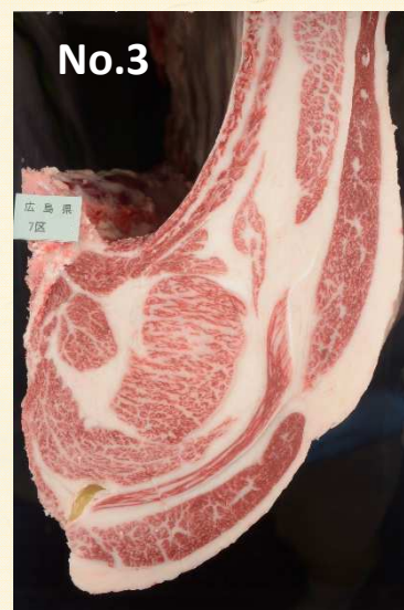
【血統】芳乃照×芳之国×安福久 【出品者】有限会社野山牧場