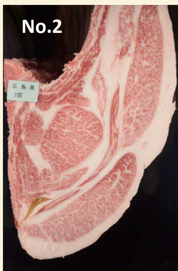
【血統】芳乃照×百合茂×安福久 【出品者】(株)のば牧場