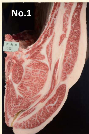
【血統】芳乃照×百合茂×平茂勝 【出品者】有限会社野山牧場