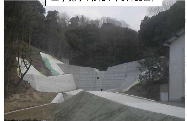
工事完了(令和4年5月18日)