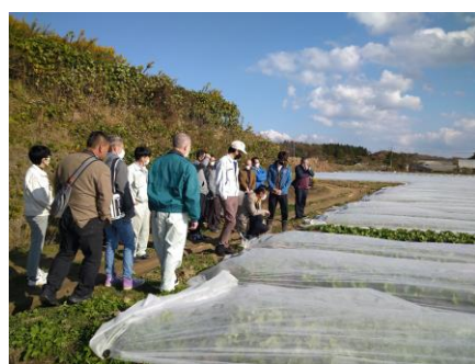
【株式会社 RABI ほ場】

広島県指導農業士会では、令和4年11月15日に、「広島県指導農業士会研修会」を開催し、県内の指導農業士のほか広島市や農業技術指導所の職員など、計25名が参加しました。