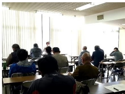
【広島市の事業紹介】