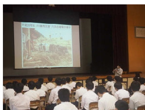
砂防出前講座 (広島市立城山北中学校)