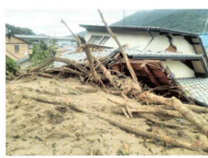
平成30年7月豪雨災害 [安芸郡海田町]