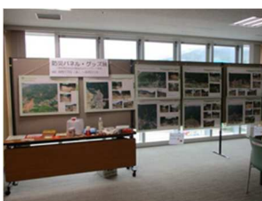
災害伝承パネル展 (広島市安佐南区沼田公民館)