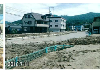
平成30年7月豪雨災害 [安芸郡府中町]