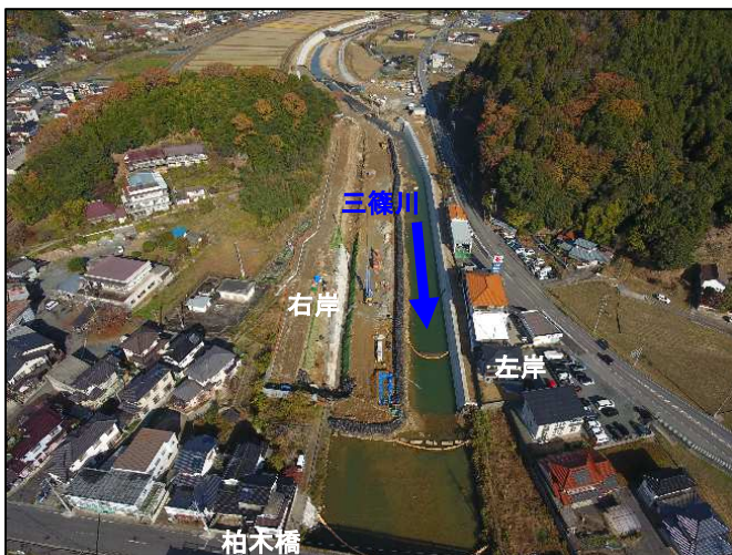
写真1 施工状況 (下流側)