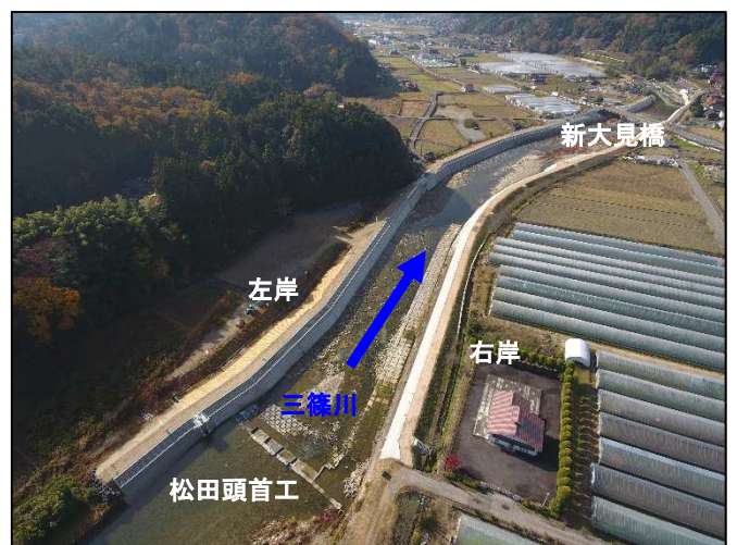
写真2 施工状況 (上流側)