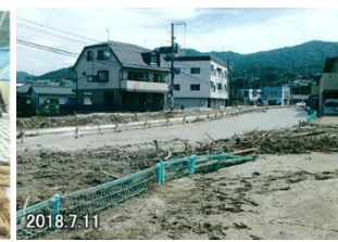
平成30年7月豪雨災害 [安芸郡府中町]