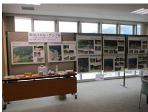
災害伝承パネル展 (広島市安佐南区沼田公民館)