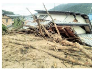
平成30年7月豪雨災害 [安芸郡海田町]