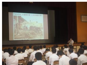
砂防出前講座 (広島市立城山北中学校)