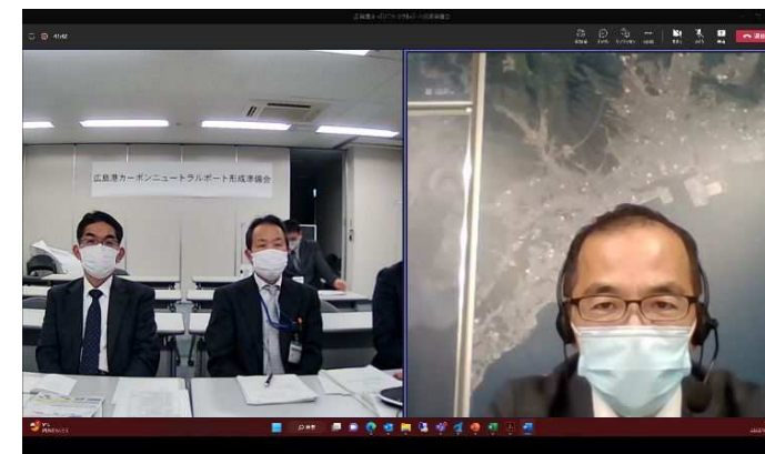
広島港カーボンニュートラルポート形成準備会 開催状況