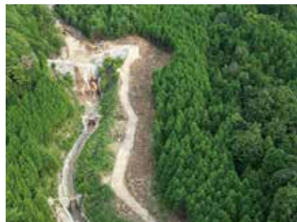
災害関連緊急砂防事業(広能川)

国土交通省や関係部署と何度も協議を重ねて策定をした事業で、計画の進め方や考え方、説明の仕方等、大変さも含めて多くを学べた貴重な経験でした。