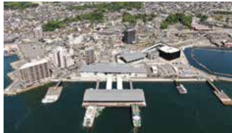
地方港湾厳島港(宮島口地区)【現況】