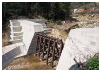
完成した砂防堰堤

時間単位での細かな休暇取得により柔軟な働き方ができ、仕事をしながらも子育てにしっかりと関わられています。例えば、妻に代わって上の子を幼稚園へ送迎をしたり、節分や七夕などの行事の日に定時よりも早く帰宅するなど、充実した日々を送れています。