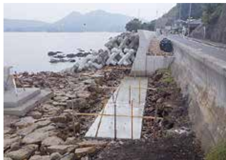
海岸保全施設整備（倉橋漁港家之元地区）