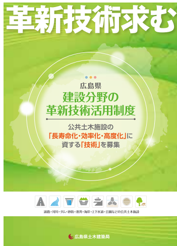
革新技术活用制度

技術企画課では、公共土木施設の老朽化の進行や建設分野の担い手不足等の課題解決などに向けて、施設の長寿命化やインフラ整備等の効率化・高度化に資する技術を募集し、登録を行う「広島県建設分野の革新技術活用制度」を運営しています。私は、事業者からの相談・申請の受付や有識者会議での意見聴取に向けた調整・資料作成など、本制度の主担当として携わっています。