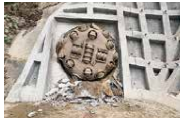
二期トンネル整備工事（掘削機貫通の様子）