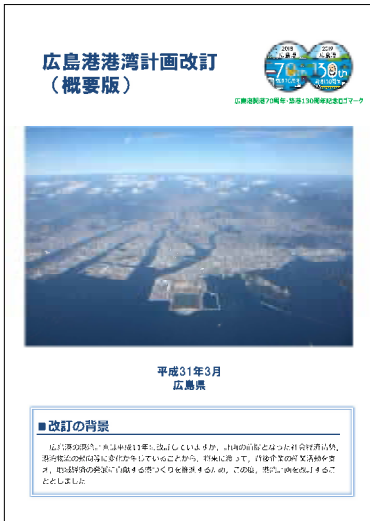
広島港湾計画改訂（概要版）

子育ては特に子供が小さな時期は、予定通りいかないものですが、育児に関する休暇制度や在宅勤務などサポート体制も充実しており、最近では女性だけでなく男性が育児休業を取得するなど働きながら育児をしている職員はたくさんいるので、子育て家庭への理解とサポートが得られやすい職場で安心して働き続けることができます。