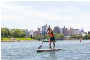
SUPの様子@本川～元安川

最近の趣味はSUPです。街中を流れる元安川や京橋川などを漕いでいると、「なんて美しい街なのだろう」といつも感動し、この景観を残してくれた「祖先」に感謝するばかりです。同時に、私たちは、どうしたら「よき祖先」になれるのか。未来の広島県民に負の遺産を残した「悪い祖先」にならないためには、今、どんな行動をすれば良いかを考える時間にもなっています。そうしたマインドセットが仕事へのモチベーションにもつながり、趣味と仕事の心地よい大切な関係を築いています。