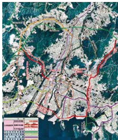
広島高速道路の事業計画

また、仕事だけではなく、家族との時間を充実させるなど、仕事とプライベートのバランスを大切にしたい働き方を実現していきたいです。