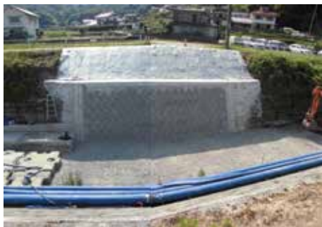
河川災害復旧工事（中切川）

私は工務課工務第二係に所属しており、河川の災害復旧工事、海岸保全施設整備を担当しています。地元の方の要望も聞き、関係機関と調整しながら工事を進めています。工事が進む過程では責任の大きさを感じますが、完成した構造物を見ると達成感に満ち溢れます。日々の業務においてもわからないことが多くありますが、できることが少しずつ増えていくことに楽しさを感じます。これからたくさんの経験を積んでいき、信頼される技術者になりたいと思います。