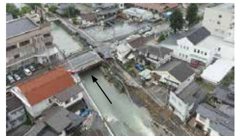
河川災害復旧助成事業(三津大川)