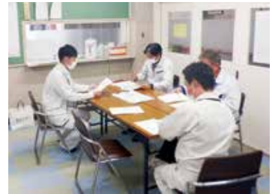
業者と協議する様子