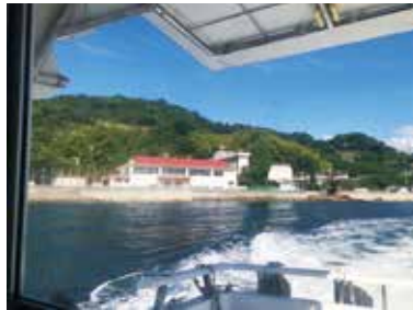
公用船による管内移動中の風景