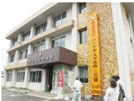
現地調査の様子(警察署庁舎)

私が担当する業務は、広島県警察の施設や道の駅のトイレその他の様々な施設の設計業務と工事監理業務です。工事によって施設がより利用しやすくなったという声を聞けることや、県民の生活を支え安全を守る施設に関わることにやりがいを感じています。工事を進める中で大変なこともありますが、工事が完了し建物が完成した時に自分の仕事がかかのためにできていると実感できることが励みになります。