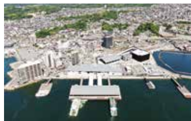
地方港湾蔽島港（宮島口地区）

特に都市計画事業（JR駅橋上化、立地適正化計画策定等）や、まちづくり検討（JR新駅検討、土地利用・区画道路検討等）など、幅広い分野や視点の必要な事業については、多くの関係者と議論しながら仕事を進めています。