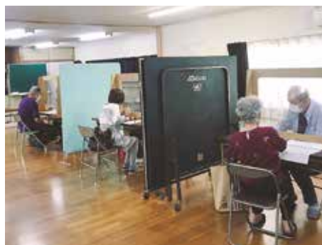
空き家セミナー相談会の様子

将来を見据え、県としての大きな視点でまちづくりに関わりながら、各地域の小さな動きも見落とさない。そのような鳥の目と虫の目をうまく組み合わせながら、仕事を進めていくことにやりがいと魅力を感じます。