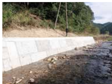
河川災害復旧事業 (長田川：完了後)