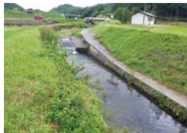
河川改良事業 (片野川：着手前)

私は、30年災がきっかけで土木についての興味を持ち、災害によって被害を受けた個所の災害復旧の現場などを見て、私自身も設計や計画などをして、工事現場での現場監督の仕事をしてみたいと思い、土木公務員を目指しました。土木公務員といっても県以外にもありますが、その中で私が広島県に入庁しようと思ったのは、自分の住んでいる地域だけではなく、広島県全体の自然豊かな土地で様々な業務に携わり、より住みやすい街にしていきたいと思い広島県を選びました。