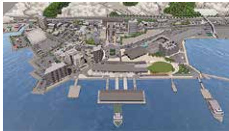
宮島口地区イメージパース

所属する職場によって、仕事の醍醐味や面白さは異なり、モチベーションは色々です。あと約15年(?)の県職員生活、そのときそのときの仕事の中でやりがいや楽しさを見つけ、これまでの経験を活かしながら、自分らしく、広島県のために働いていきたいと思っています。また、子育ても落ち着いてきた今、いくつかの趣味について、満遍なく楽しむか、何か一つに集中するか、迷っている今日この頃です。私生活も自分らしく、楽しみたいです。