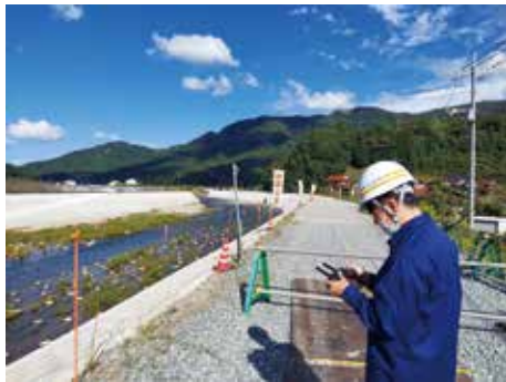
ドローンで現場を撮影する様子

所属している課のホームページの更新や、自分が担当している工事現場が動いているのを見た時など、やったことが目に見えて変化したときや、地元の方に感謝された時などにやりがいを感じます。これから自分が監督する工事を持つようになり、完成したものが地域をよりよくできると考えると仕事をもっと頑張ろうと思えます。