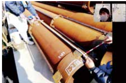
ZOOMを活用した工事の立会