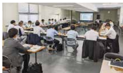
建設業界との意見交換会