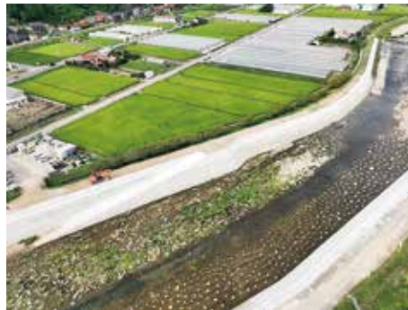
ドローンで撮影した写真