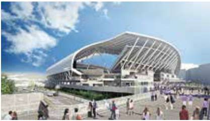
新サッカースタジアム（イメージ図）

特に、今年は新サッカースタジアムや広島西飛行場跡地の多目的スポーツ広場の工事着手など、計画が現地で具体的に動き出すタイミングとなりました。様々な紆余曲折を経て実際にモノが出来ていく様子を担当者として見られることは、感慨深いものがあります。完成まではもう少しかかりますが、県民の皆さんに喜んでもらえる施設を目指し、夢を形に出来る仕事にやりがいを感じています。