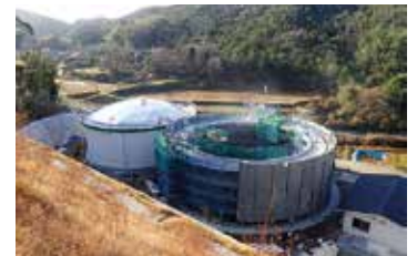
黒瀬調整池新設工事（PCタンク設置の様子）