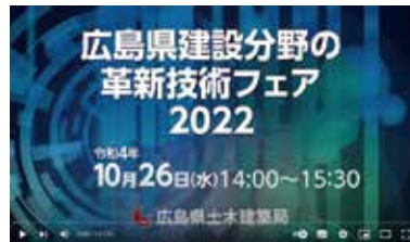
YouTubeチャンネルを開設し、初めてのライブ配信！ 私もYouTubeデビューしました！

革新技术活用制度の策定です。本制度は施設の長寿命化に資する技術を募集・登録する「広島県長寿命化技術活用制度」から令和4年4月に改正した制度であり、改正にあたり有識者の方々と議論してきました。新たな制度をより良いものにするために、深く考え、しっかりと議論するという一連の過程は非常に大きな経験になりました。