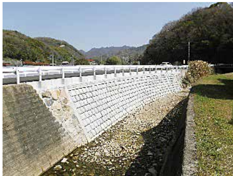
河川災害復旧工事 (木谷郷川)

学生時代に海洋開発に関する研究をしていたことや結婚等を希望調査時に伝えたところ、自分が希望した配属先になりました。職場の上司の話を知ると、将来的な異動についても家庭環境等をある程度を考慮してくれるそうです。