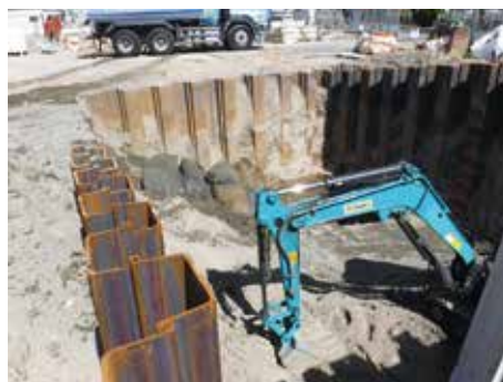
施設解体工事現場の様子