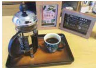
趣味のコーヒーを楽しむ様子

業務ではコンペに関するイベントや審査会の準備や運営等を行っています。調整は大変ですが、建築家の方と打ち合わせを行ったり、イベントでは実際舞台に出て説明したり