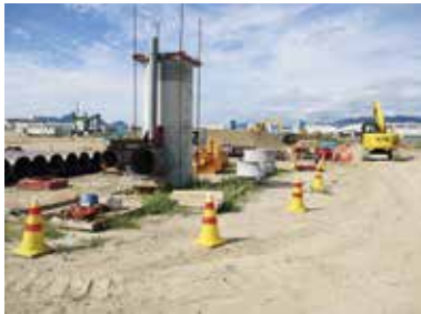
五日市地区下水道整備工事

前職では、河川改修や災害復旧、橋梁点検など港湾とは全く別の分野に携わっていましたが、現在は埋立地の下水道整備工事を担当しており、これまでの経験とは一見関係のないように見えますが、積算や工事監督の基本事項は共通することが多く、また経験と勉強を繰り返し積み重ねていくことが大切という点はどちらも同じです。今後も、色々なことに興味を持ち、積極的に学ぶ姿勢を大事にしていきたいです。