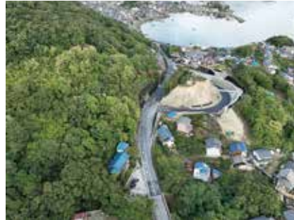
鞆松永線道路改良工事

現在、主にデジタル技術をはじめとしたテクノロジーの進歩により、様々な事物が変化しており、今後はそのスピードもより速くなることが予想されます。時代の変化に振り回されず、地に足つけて歩くためには、過去や経験に加えて、新たな考えや発想も吸収できる柔軟性が大事になると考えています。