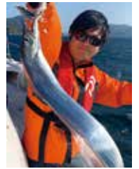
休日を利用した 太刀魚釣り