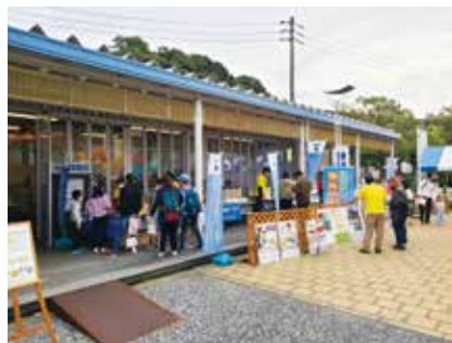
子育てスマイルマンション認定制度 住生活月間「住まいの情報プラザ」の様子