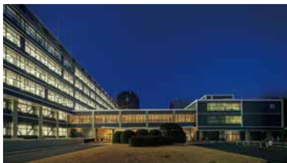
県庁舎本館等耐震化事業 (H28-R3担当)

平成24年度に東日本大震災の災害応援派遣者となり、1年間、福島県で津波や地震で被災した県有施設の復旧工事に係る業務に携わったことです。当時、被災1年後の災害の爪痕深い被災地を目の当たりにして、その現場で復興に少しでも貢献したいと想いました。そのような想いを持ちながら他の自治体職員の方々と共に働いた経験は、今でも自分の財産となっています。