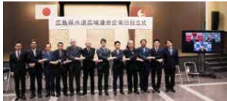
広島県水道広域連合企業団設立式

多くの県民の方々の生活が豊かになるように、新技術も積極的に取り込みながら各場面に適した形での事業を進めていけるように取り組んでいきたいです。