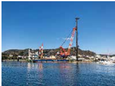
防波堤の鋼管基礎杭打設状況

広島県に貢献し、仕事にやりがいを感じたいと考えている皆さん、是非、一緒に仕事をしましょう!!