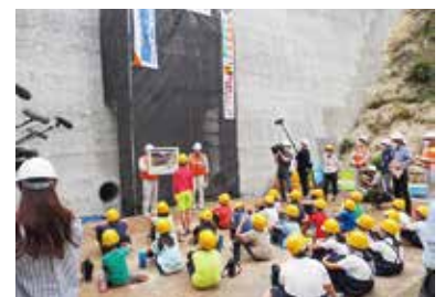
小学生への現場公開の様子