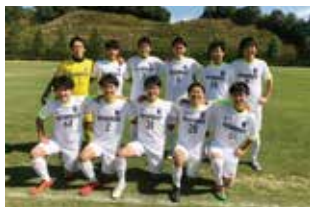
所属チームのサッカーの試合

どちらかを諦める必要はなく、仕事と暮らしをバランスよく両立できる環境を整えることにより、仕事への新たな意欲やモチベーションの向上にもつながると思います。