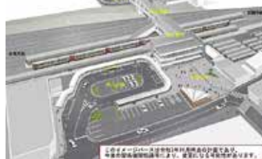
大竹駅（イメージ図）