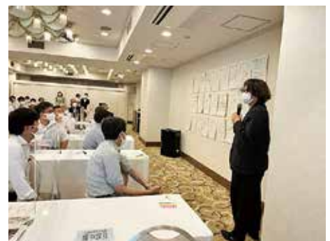
未来勉強会の様子