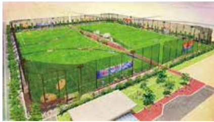
広島市西飛行場跡地の多目的スポーツ広場（イメージ図）