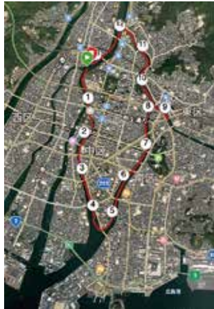
広島市内一周 13km コース