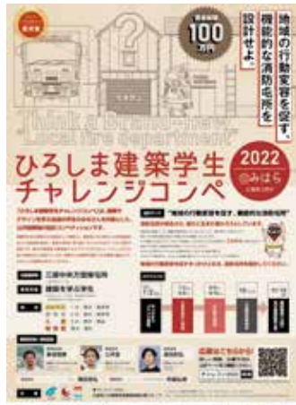
ひろしま建築学生チャレンジコンペ 2022@みはら ポスター

私の所属する営繕課では広島県内の建築の魅力創造・発信する「魅力ある建築物創造事業」を実施しており「ひろしま建築学生チャレンジコンペ」の担当をしています。全国の建築学生を対象にアイデアを募集し、最優秀に選ばれた作品は学生が実務に関わりながら実際に建築されることが大きな特徴です。ほかに「広島型プロポーザル」や「ひろしまたてものがたり」等を行って