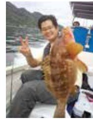
休日を利用した アコウ釣り