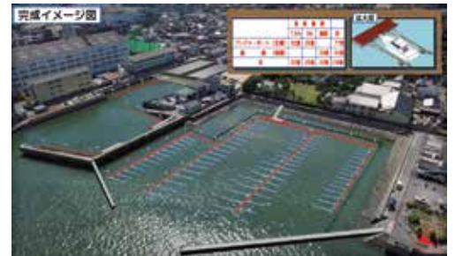
尾道糸崎港 係留施設完成イメージ