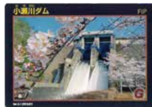
小瀬川ダムのダムカード

そして、ダムグループに配置されたこともあり、同僚や友人と美味しいものを巡りながらダムカードを集めています。みなさんも、趣味と仕事が結びつくかもしれません。民間に比べて、比較的休みを取りやすいと思うので、自分に合ったライフスタイルを見つけてみてください。