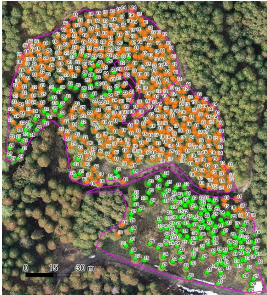
図3 スギ・ヒノキ立木分布図（数字は樹高、●：スギ、●：ヒノキ）