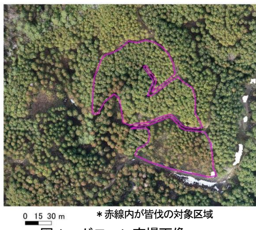
図1 ドローン空撮画像