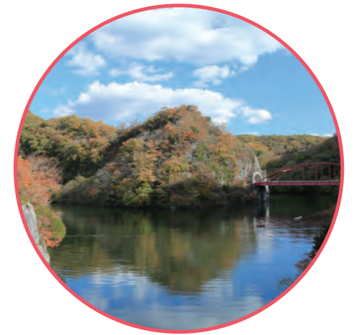
帝釈峡 (庄原市/神石高原町)