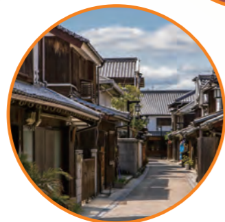
御手洗町並み 保存地区 (呉市 大崎下島)