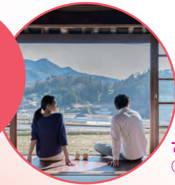
古民家ステイ (庄原市)