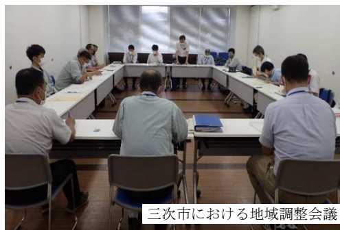
三次市における地域調整会議

意向調査実施区域の森林資源情報や地元説明に係る資料を作成・提供するとともに、経営管理集積計画の策定、経営管理実施権の設定等を支援した。(16市町が意向調査を実施)