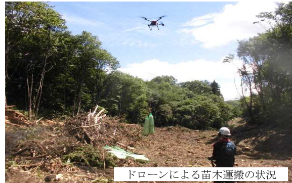
ドローンによる苗木運搬の状況