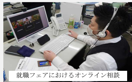
就職フェアにおけるオンライン相談

・新規就業者を確保するために、就職フェアやホームページ等を活用し、求人情報を効果的に発信した。 ・就業後の定着促進のために、Webアプリケーションを活用した健康管理システムを導入し、フォローアップ体制等を強化した。 ・林業就業への関心を喚起するために、高校生を対象に林業体験学習を実施した。