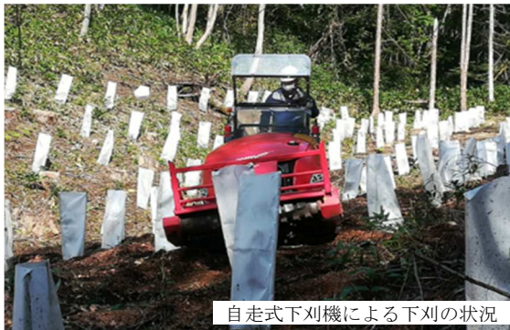
自走式下刈機による下刈の状況

伐採、地拵及び植栽を連携して同時に行う一貫作業や、自走式下刈機を利用した下刈、ドローンによる苗木運搬等を実証し、コスト縮減効果や省力化・省人化等の効果を検証するとともに、これらの取組で得られた成果を、研修会を通じて、林業関係者等へ広く普及した。