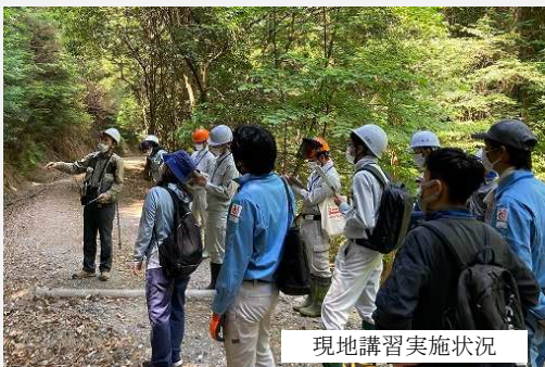
現地講習実施状況