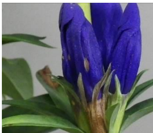
図 3 黒斑病の病徴 (花弁の斑点)