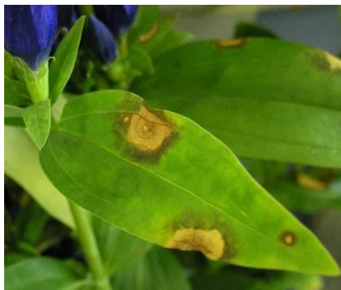
図 1 黒斑病の病徴 (本葉の輪紋症状)