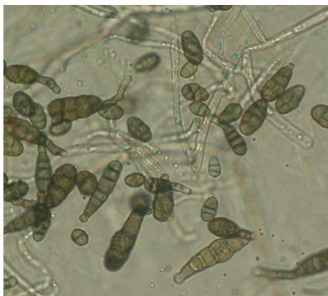
図 4 りんどう黒斑病菌