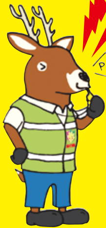
「減らそう犯罪」 広島県民総ぐるみ運動 マスコットキャラクター 「モシカ」