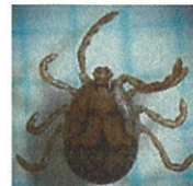
フタトゲチマダニ

気温の上昇とともにマダニの活動が活発になるため、この時期から、マダニが媒介する感染症への注意が必要です。畑仕事、草刈り、墓参りをされた方や60歳以上の方が多く感染しています。草むらや藪に入るときには、長袖、長ズボンの着用、忌避剤の使用等によりマダニに咬まれないよう注意しましょう。